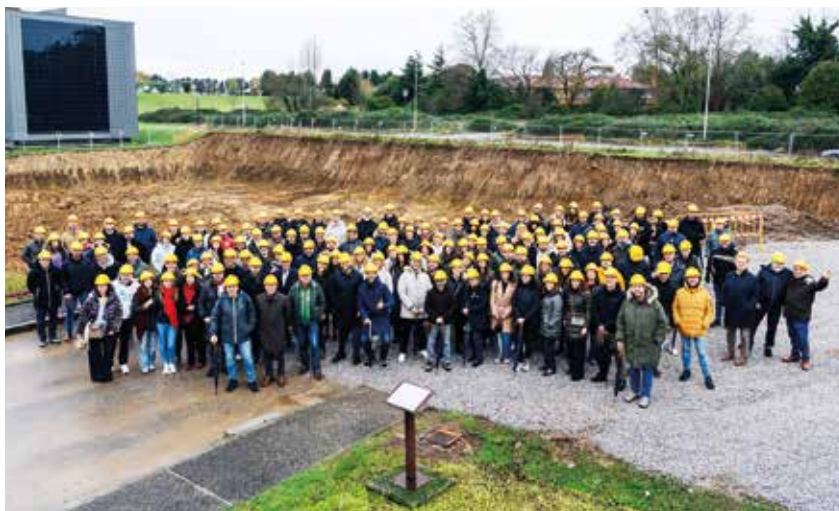
Equipo de Acuña y Fombona en los terrenos del Parque Científico Tecnológico de Gijón (PCTG) en los que se ubicará el nuevo edificio de la empresa.

Esta colaboración supone un impulso para que COCEMFE Asturias continúe desarrollando proyectos y actividades dirigidas a las personas con discapacidad física y orgánica, así como para implantar políticas dirigidas a ampliar y garantizar los derechos de estas