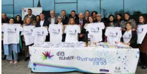
Celebramos en el HUCA el Día Mundial de las Enfermedades Raras o de baja prevalencia