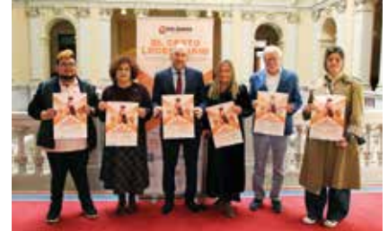
La X Solidaria oportunidades reales de inclusión, autonomía y bienestar