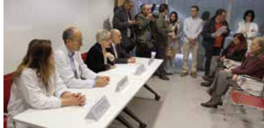
Asistimos a la presentación de la Unidad de Enfermedades Raras del HUCA