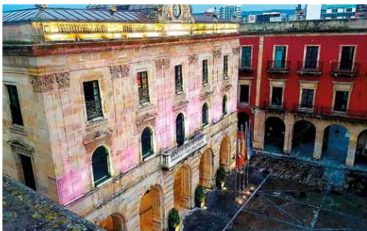
Ayuntamiento de Gijón.