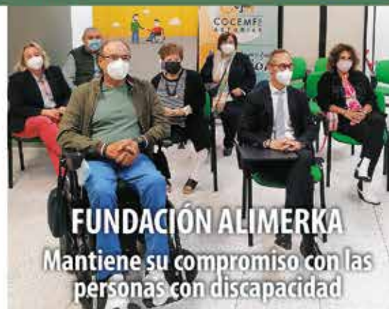
FUNDACIÓN ALIMERKA Mantiene su compromiso con las personas con discapacidad