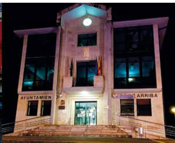
Ayuntamiento de Ribera de Arriba.