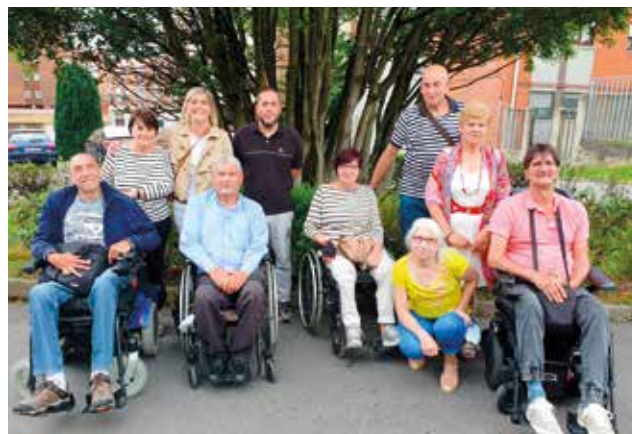
Junta directiva de DIFAC.

Buena pregunta, cuando decidí presentar mi candidatura, miré los Estatutos y vi que podía tener un máximo de 10 componentes, entonces decidí ponerlo en práctica y estamos 5 mujeres y 5 hombres, cabe señalar que 5 miembros, son usuarios de sillas de ruedas.