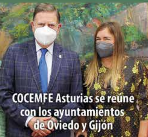
COCEMFE Asturias se reúne con los ayuntamientos de Oviedo y Gijón

Consejera de Derechos Sociales y Bienestar