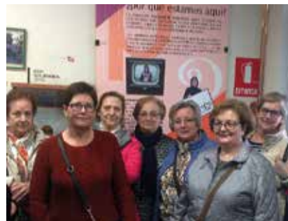
Taller para personas cuidadoras.

En la actualidad se están atendiendo un mayor número de demandas debido a la situación de confinamiento vivido y