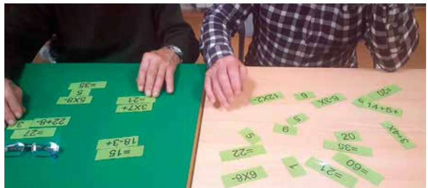
Taller de estimulación cognitiva.

Los resultados que se esperan conseguir con esta atención son incrementar y/o mantener el mayor grado de bienestar personal de las personas afectadas el mayor tiempo posible facilitando así una mayor integración socio familiar.