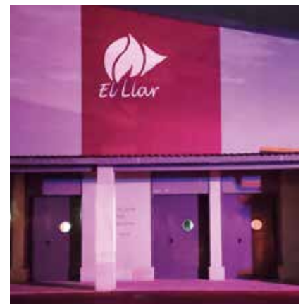
Teatro El Llar en Corvera.

Aunque la vida a veces es empinada, las vistas son espectaculares.