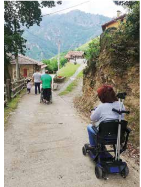
Senda accesible de Campiellos.