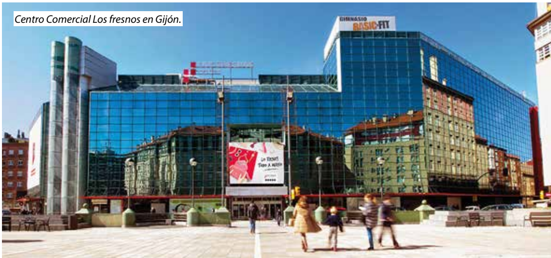
Centro Comercial Los fresnos en Gijón.